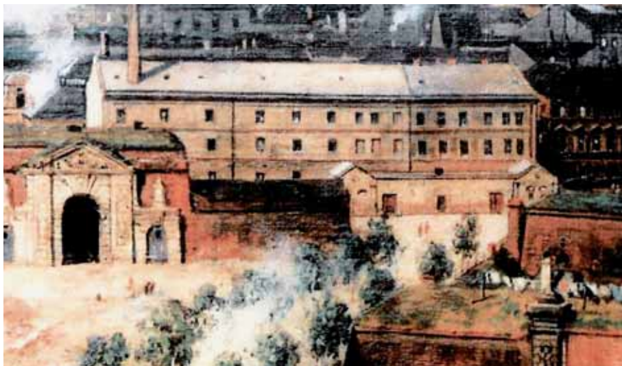
1895, olej na plátně, výřez – budova mlýna za Terezkou bránou a zbytkem hradeb