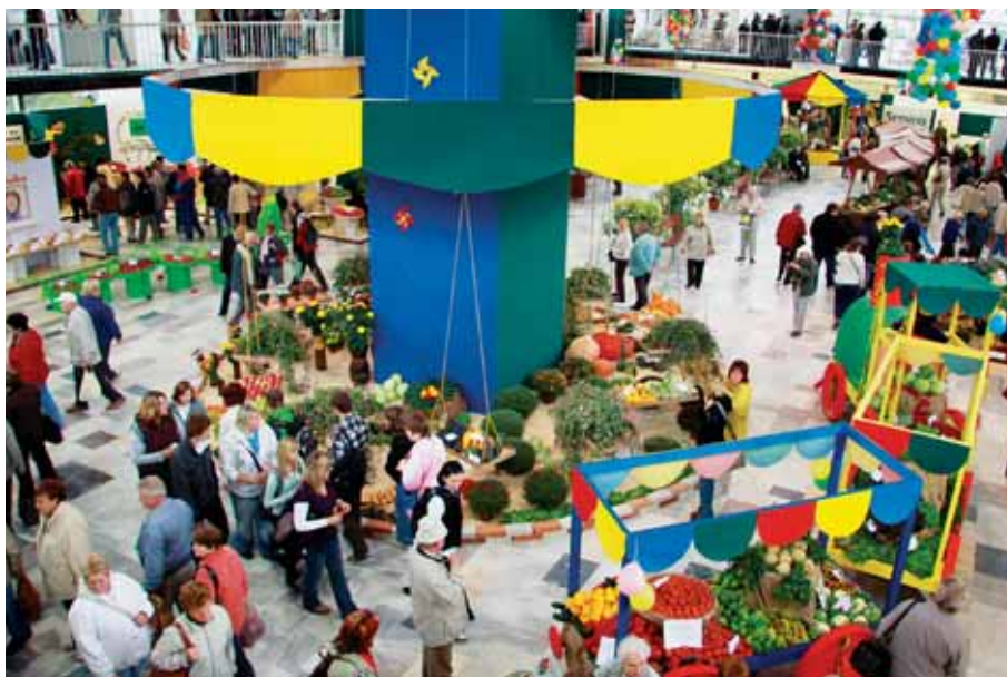
Veletrhů v Olomouci ani v roce 2010 nebudou