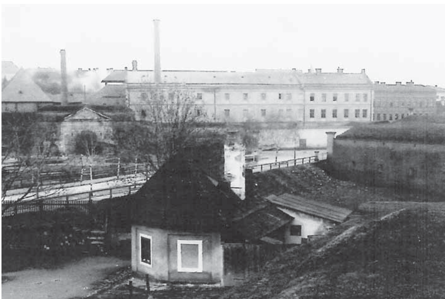
Konec 19. století, pohled na budovu mlýna