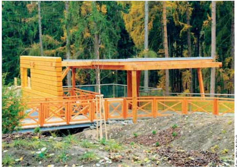
Nový společný výběh medvědů a vlků v zoo bude oficiálně otevřen na jaře

„Současně chceme pokračovat v prevenci kriminality prostřednictvím rozšíření kamerového systému instalací 20. a 21. kamery do přednádražního prostoru a křižovatky ulic 8. května – Pekařská – Zámečnická – Opletalova v návaznosti na statistiku nápadu majetkové a ná-